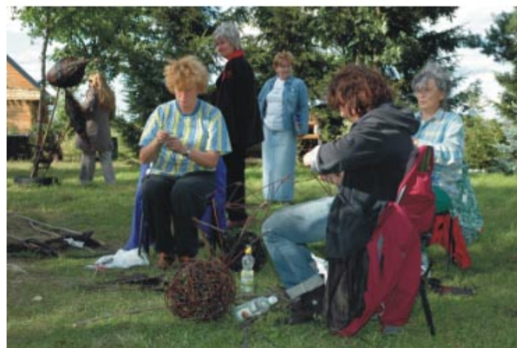
Uczestnicy pleneru w Konarzewie z wiklinowych gałązek wyczarowują piękne przedmioty codziennego użytku oraz najróżniejsze ozdoby