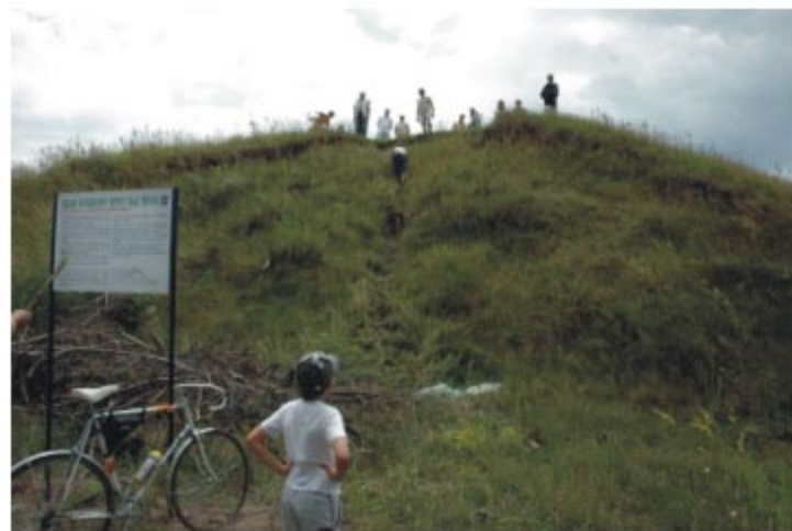
Szlak Bitwy nad Bzurą wiedzie m.in. przez "Łysą Górę" - pozostałości grodziska stożkowatego, na którym kiedyś stała budowla obserwacyjna

W niedzielę 1 lipca w Piątku miała miejsce inauguracja nowego szlaku rowerowego - "Bitwy nad Bzurą". Licząca 46 km trasa rowerowa prowadzi po najpiękniejszych miejscach naszej gminy, ze szczególnym uwzględnieniem terenów, na których prowadzone były walki we wrześniu 1939 roku. Na szlaku wiodącym z Piątku przez Janowice, Balków, Goślub, Michałówkę, Ciechosławice, Pęcławice, Łysą Górę, Orenice, Łękę, Sułkowice, Witów, Konarzew do Piątku można zobaczyć pomniki poświęcone wydarzeniom Września 1939 r., zespoły pałacowo-parkowe, zabytkowe drewniane kościoły,