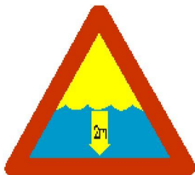
Niebezpieczna głębokość wody