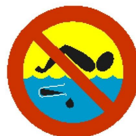
Kąpiel zabroniona — woda skażona