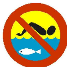
Kąpiel zabroniona — hodowla ryb