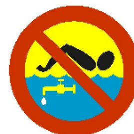
Kąpiel zabroniona — woda pitna