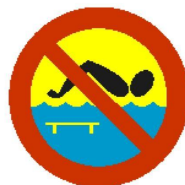
Kąpiel zabroniona — most