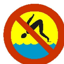
Skakanie do wody zabronione