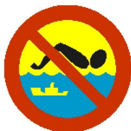
Kąpiel zabroniona — szlak żeglowny