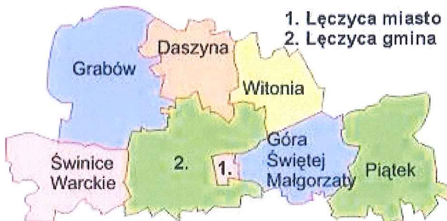
Rysunek 1. Gmina Piątek w powiecie łęczyckim

Gmina Piątek zajmuje obszar 133 km 2 . Według danych GUS z końca 2016 roku Gmina liczy 6.112 mieszkańców, a gęstość zaludnienia to w przybliżeniu 46 osób/km 2 . Gmina Piątek leży we wschodniej części powiatu łęczyckiego.