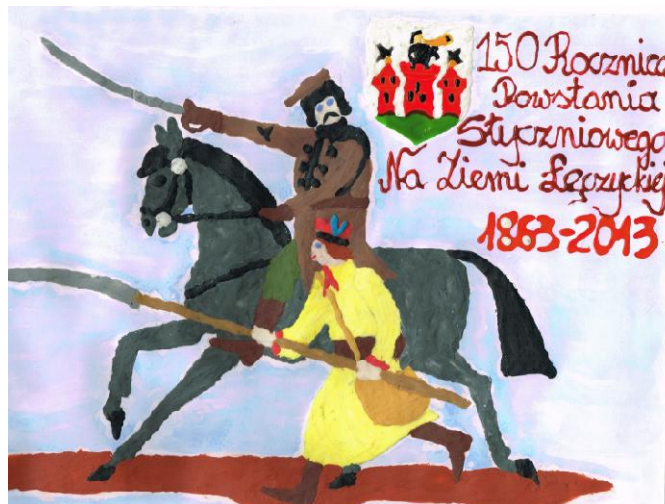
Tomasz Skowron - Szkoła Podstawowa w Czernikowie