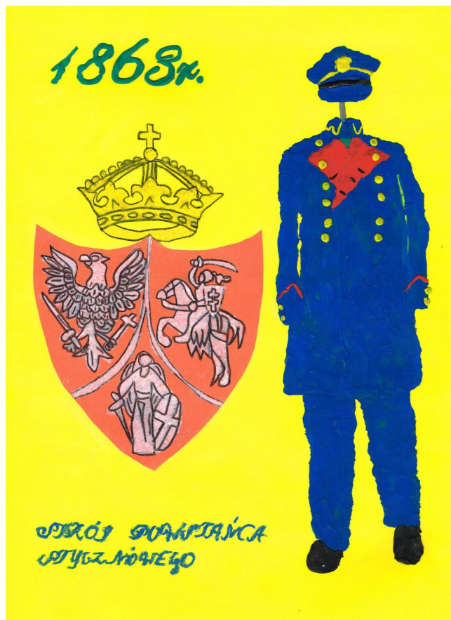
Aleksandra Kubiak - Szkoła Podstawowa w Czernikowie